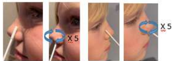
Barn 7 år

Rør pinnen rundt på innsiden av neseboret 5 ganger.